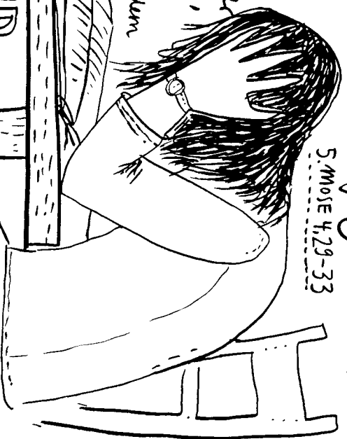
5. MOSE 4, 29-33

wenn du aber dort den Herrn, deinen Gott, suchst wirst, ja wirst du ihn finden. wenn du ihn von ganzen Herzen und von ganzer Seele suchst wirst. WENN DU BEGÄNGST SEIN } und dich das alles wirst } heilend und in künftigen so wirst du dich bekehren zu dem Herrn, deinem Gott, und seiner Stimme gehorchen. DENN DER HERR dein Gott, ISST EIN BÄRMHERZIGES GOTT Er wird dich nicht verlassen noch werden WIRD. AUCH DEN BUND NICHT VERGESSEN. DEN ER DEINEN. VÄTERN GESCHWOREN HAT. DENN frage nach den früherenzeiten, die vor dir gewesen sind, von dem Tage an, da Gott den Menschen auf Erden geschaffen hat, und von Einem Ende des Himmels zum Andern, ob je so großes geschehen oder dergleichen je gehört sei, DASS EIN VOLK DIE STIMME GOTTES aus dem Feuer hat reden hören wie du SIE GEHÖRT HAST, UND DENNOCH AM LEBEN BLIEB?